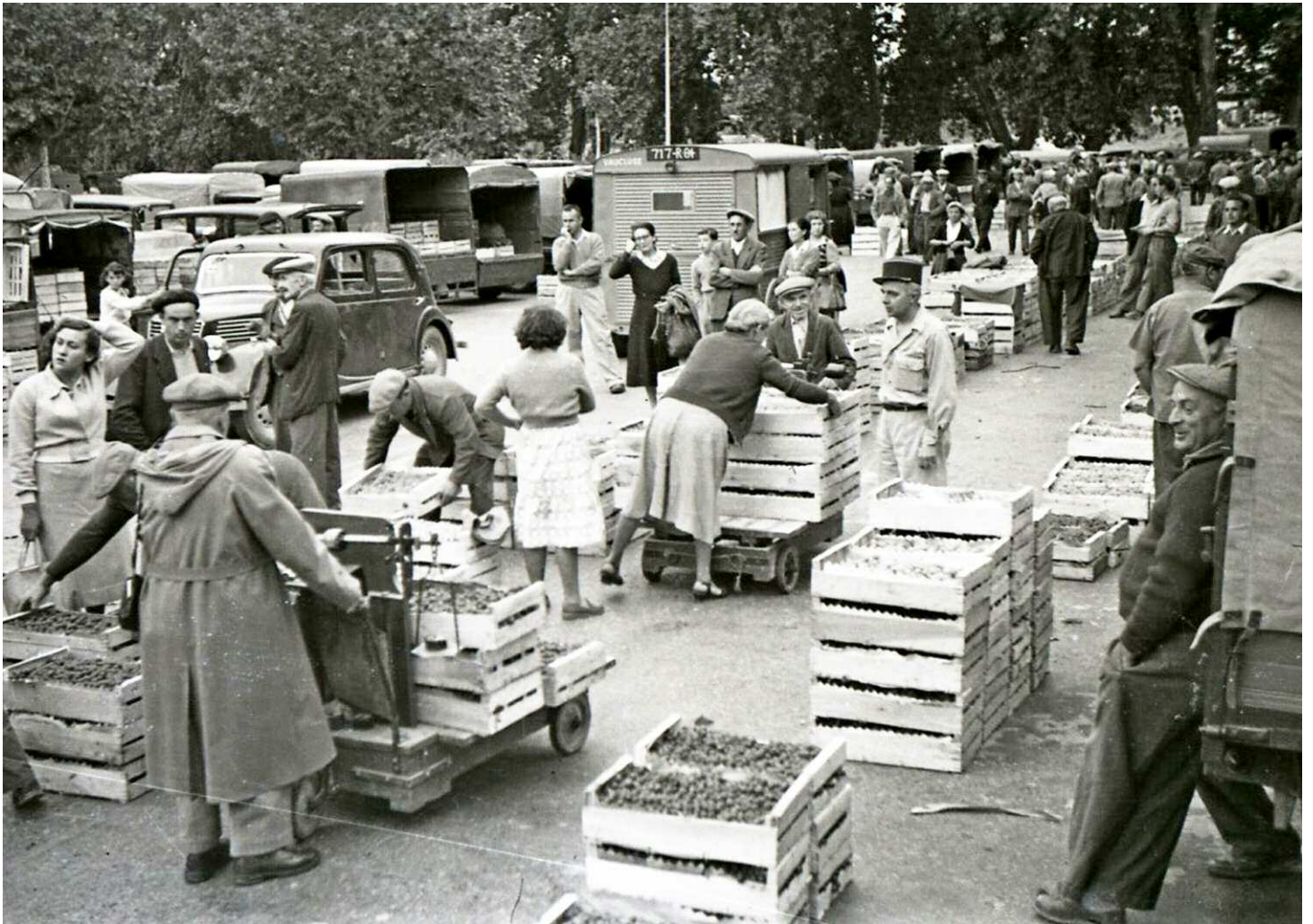
Marché et melons à La Vilasse