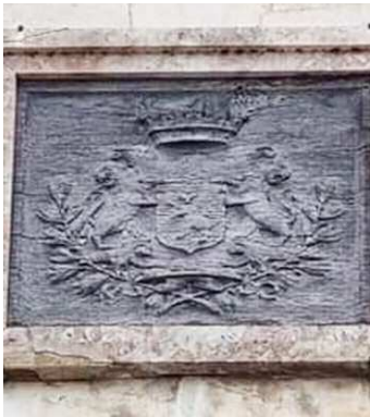
Le plus ancien (école)