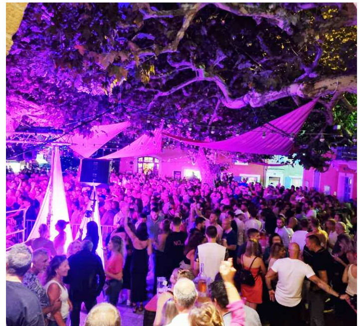
La soirée « Rosé » du 5 août