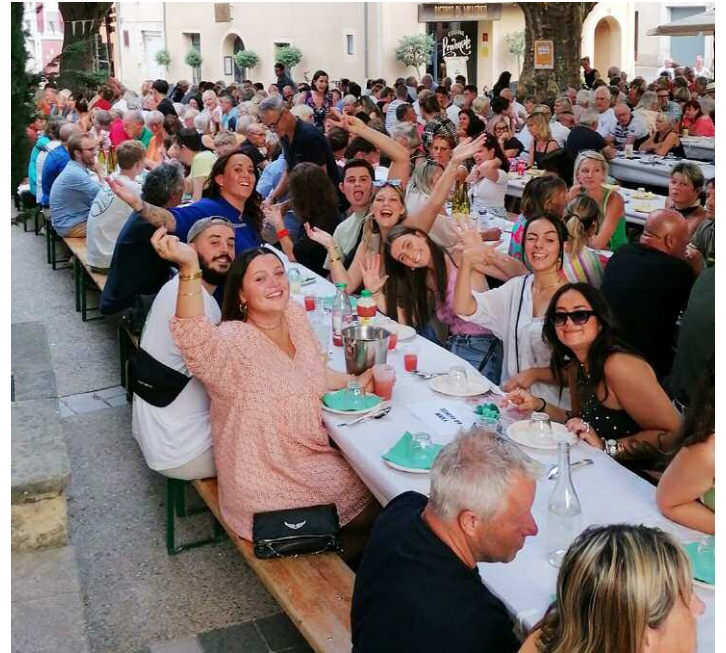
Le Pistou du 22 juillet