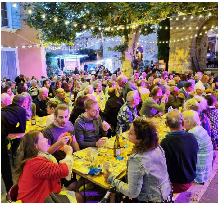
L'aïoli du 4 août