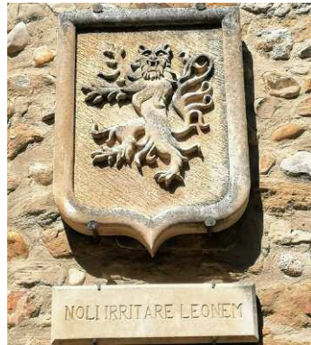
Le plus récent (remparts)

N ous avons cherché des renseignements sur le blason qui se trouve sur le fronton du groupe scolaire.