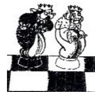
De l'eau dans le gaz entre la reine et le roi ?