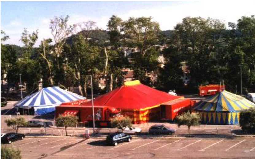
Pour les 10 ans de Badaboum en 1999, on reconnaît le chapiteau de Villedieu à droite de la photo