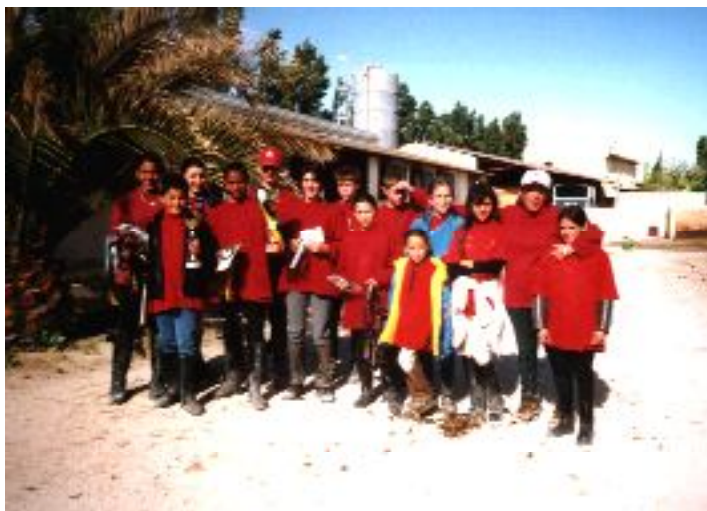
L'équipe de Vaison après la remise des récompenses à Caderousse le 5 mai

rière pour l'obstacle. Ils lui permettront aussi d'accueillir l'année prochaine des compétitions de pony games ce qui n'était pas possible jusqu'à présent.