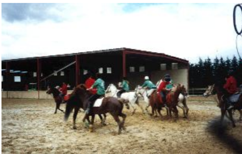
Les Big de Vaison contre les Vipères de Caderousse, la meilleure équipe de Horse ball du coin. Ca déménage !

année championne de Vaucluse de dressage.