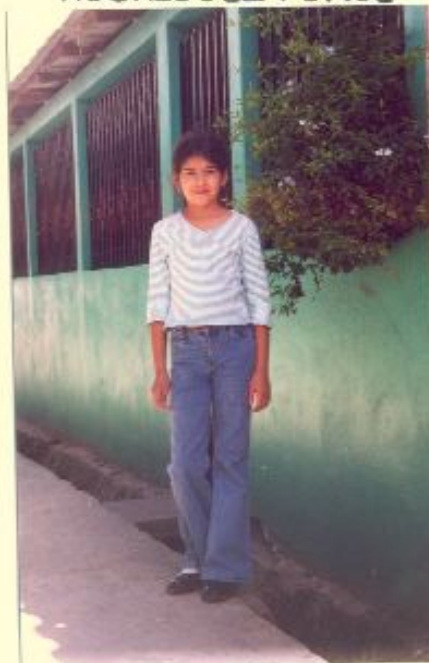
Née le 4 Mars 1995 à Santa Barbara Honduras - Amérique Centrale