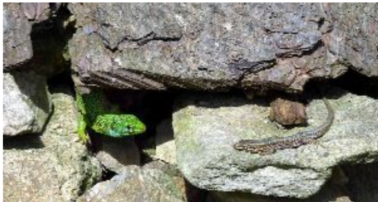
Lacerta viridis à gauche et lacerta muralis à droite

autre affaire... Rapide comme l'éclair, il plonge dans un trou ou une fissure de mur et ne réapparaît ensuite que très prudemment. Là-dessus, une anecdote,